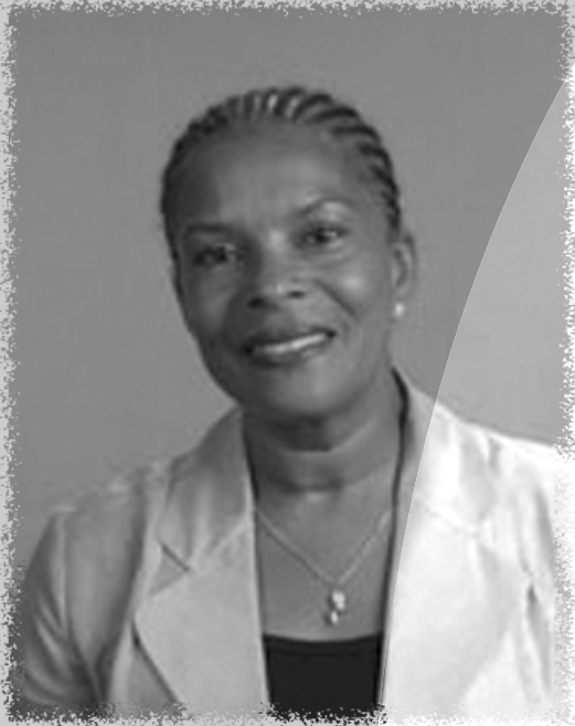
Christiane Taubira , 1 ère Vice-Présidente et candidate du PRG à l'élection présidentielle de 2002.